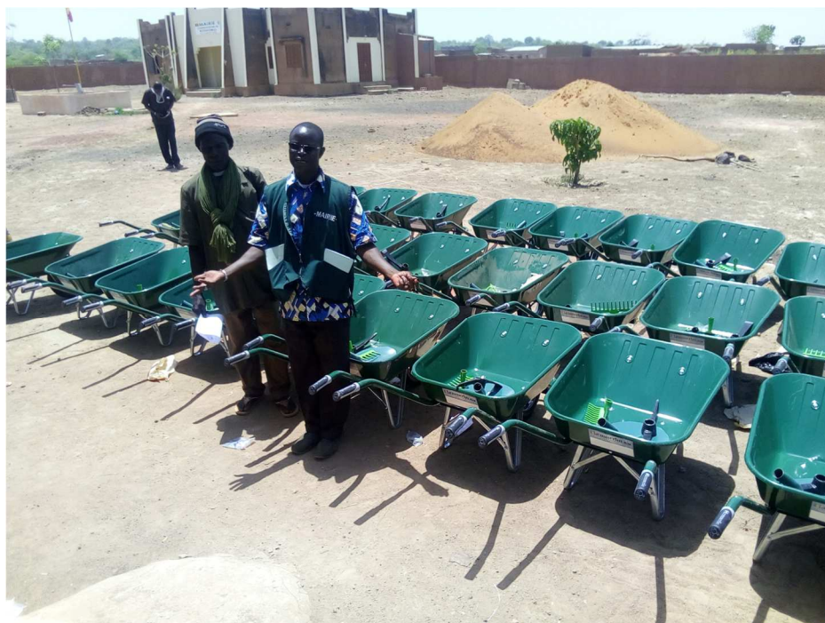
Réception des kits

C'est pourquoi, le maire de la commune de Kouoro, a fait une demande d'extension à d'autres villages en 2018. Suite à cette demande le CEPAZE a financé 30 kits de production de compost pour 30 exploitations de 03 villages, pour 22 femmes et 8 hommes. Il faut reconnaître que l'identification des bénéficiaires a été faite avec une forte implication de la mairie et surtout maire de Kouoro. Cela est un atout pour la réussite du projet. L'agriculture durable est un réel enjeu pour les populations de la commune de Kouoro.