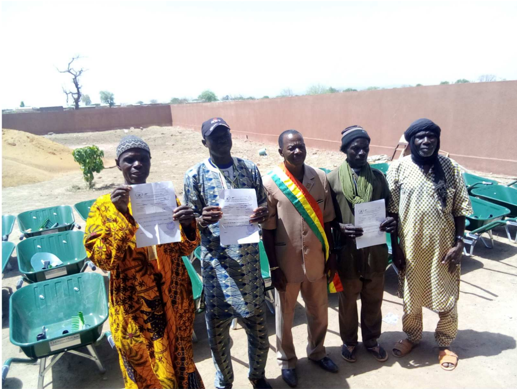
Attestation du matériel reçu

2) Le CEPAZE a été récemment sollicité pour rejoindre le Groupe de Travail sur la Désertification - lui-même affilié au Réseau Sahel Désertification (ReSaD) -, en raison de ses activités en lien avec la lutte contre la désertification et l'insécurité alimentaire : pratiques agricoles durables, nouvelle méthodologie de maraîchage et, actuellement la form'action en Permaculture qu'il souhaite organiser en novembre à Bamako, en partenariat avec GAE Sahel.